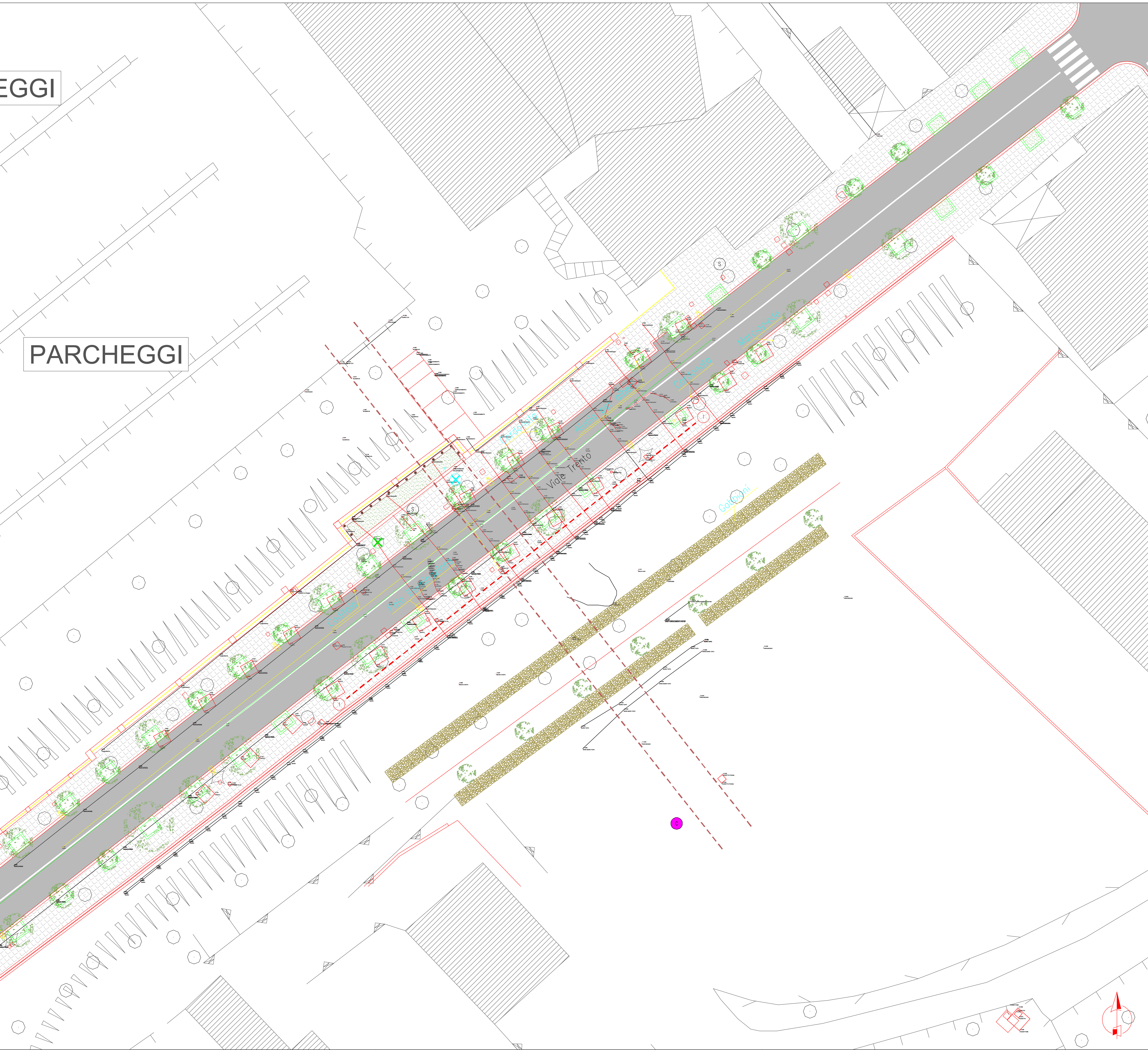
Key - Map